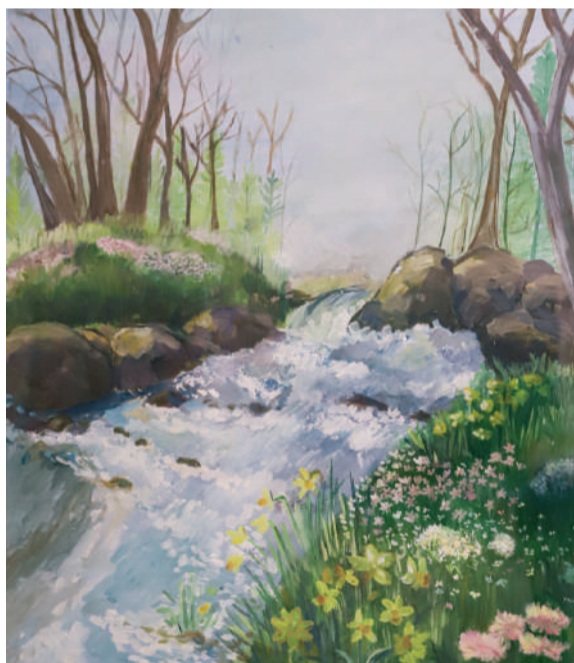
«Пробуждение природы», Алина Головки, 4 класс ДШИ КГИК

В Краснодарском институте культуры открылась выставка «Весенняя капель». Учащиеся Детской школы искусств КГИК изобразили на своих полотнах это нежное время года в разных проявлениях. Предлагаем полюбоваться и читателям газеты!