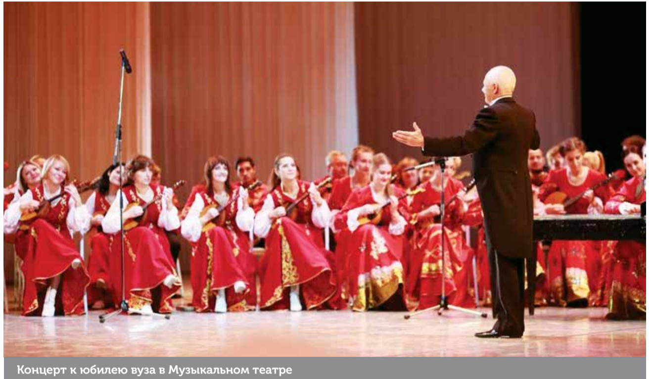
Концерт к юбилею вуза в Музыкальном театре

ние месяцы в институте, который стал для меня вторым домом, так сильно изменив мою жизнь и открыв для меня новые горизонты. «Будущее всегда туманно, да и новизна пугает, но тот, кто не смотрит вперед, останется позади» (Д. Геберт). В студенческой среде особая атмосфера. Мы покинем эти стены, на наше место придут другие – таков закон жизни, но душу долгие годы будут греть теплые воспоминания: об удивительных событиях, о первых серьезных ошибках, о ранних подъемах для самостоятельных многочасовых занятий, о кровавых мозолях на пальцах, которые приходилось заклеивать медицинским клеем (да, такой существует) и выходить на конкурсную сцену, об огромном количестве выученных музыкальных произведений различных эпох и жанров, о ярких концертных выступлениях с ведущими музыкан-