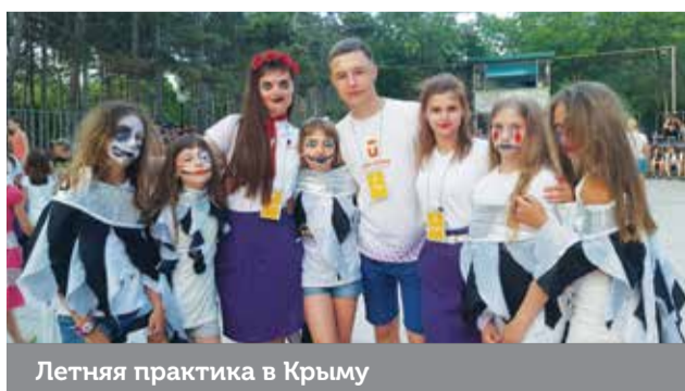
Летняя практика в Крыму